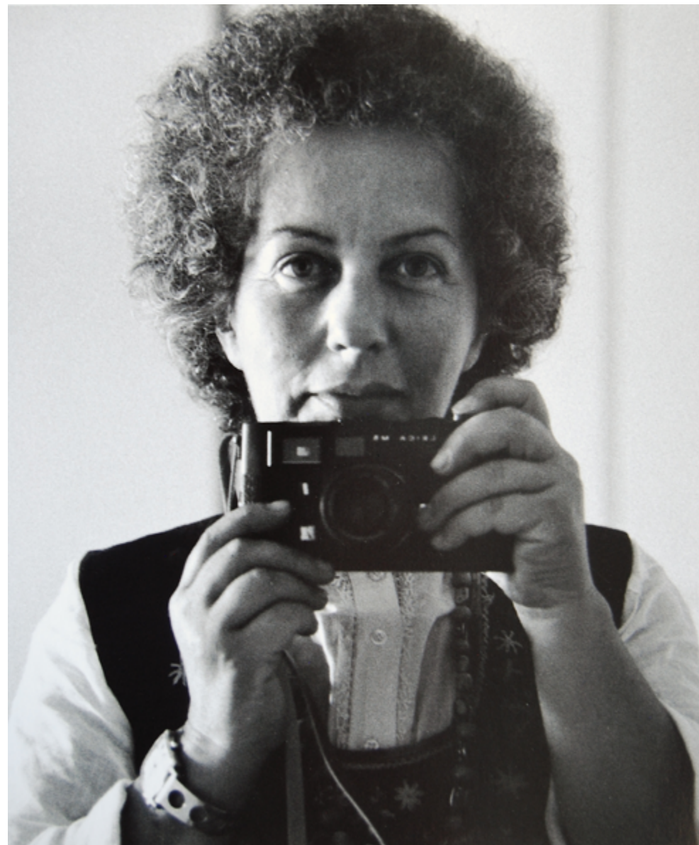
Lisetta Carmi, Autoritratto, 1974, © Martini & Ronchetti, courtesy archivio Lisetta Carmi

In occasione dei cento anni dalla nascita di Lisetta Carmi, Palazzo Ducale presenta una grande mostra dell'artista e fotografa genovese, che nel corso della sua vita ha avuto il coraggio di percorrere vie diverse dando sempre voce agli ultimi. Un viaggio che parte da Genova e dall'Italia per raccontare, con il suo sguardo acuto e lucido, realtà lontane e mondi in trasformazione, con inedite immagini a colori che affiancano le serie più famose in bianco e nero. In mostra le immagini della serie dei travestiti degli anni Sessanta, pubblicate nel 1972 suscitando scalpore e segnando le ricerche fotografiche di molti artisti internazionali, e la serie inedita Erotismo e autoritarismo a Staglieno , in cui il monumentale cimitero genovese si trasforma, sotto l'obiettivo della fotografa, in un ritratto della società borghese ottocentesca e dell'erotismo associato ai monumenti funebri. La città di Genova emerge anche in altre sfaccettature inaspettate, col racconto del mondo del lavoro nelle famose immagini del porto di Genova e dell'Italsider ma anche in quelle, in parte inedite, dell'Anagrafe e degli aspetti della vita culturale e sociale della città.