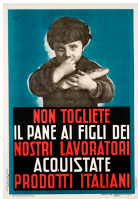
Mario Roveroni. Acquistate prodotti italiani!, 1935 ca., stampa litografica a colori, Wolfsoniana - Palazzo Ducale Fondazione per la Cultura, Genova, GE1935.2:159

Secondo ciclo della scuola primaria, secondaria di I e di II grado