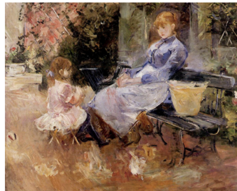
Berthe Morisot, La favola , 1883 Olio su tela, 65 x 81 cm Collezione privata, CMR 139

Scuola infanzia e primo ciclo scuola primaria